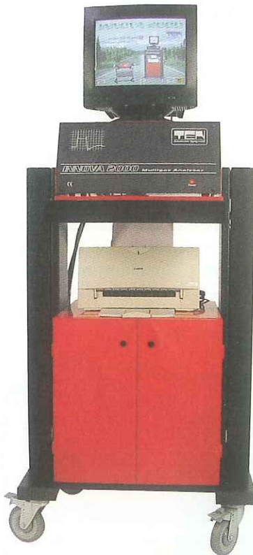
AUsgesprochen flexibel: Der Abgastester Innova 2000 prüft Leitfaden-III-kompatibel und beherrscht auch die AU an Krafträdern (AUK).

Mit dem Innova 2000 bietet Eichstädt Elektronik ein Abgas-Kombi-Gerät für die AU an Otto-, Gas- und Dieselmotoren sowie Krafträder an. Das kompakte PC-Gerät kommt ohne externe Baugruppen aus, die Anschlusskabel sowie die Abgassonde werden in den Säulen des Fahrwagens verstaut.