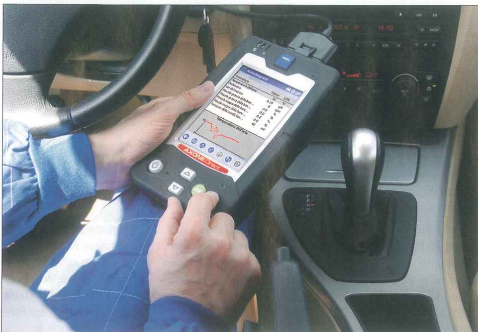
Der Axone Direct von Texa verbindet praktische Größe mit einfacher Bedienung.

Der Axone Direct macht Diagnose bezahlbar